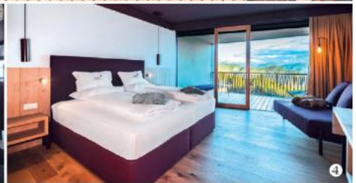
1 Wellness-Hotel Belvedere mit neuem, modernem Erweiterungsbau | 2 Infinity-Pool mit Aussicht | 3 Design-Bar im Lobbybereich | 4 Grosse und praktische Hotelzimmer | 5 Viel Platz für die Gäste in der Sauna | 6 Panoramarestaurant mit hellem Holz

Aussen- sowie Innensauna, Whirlpool und grosszügige Ruhebereiche ergänzen das Angebot. Anschliessend wird in der holzgetäfelten Stube ydes Fine-Dining-Restaurants «Frieda» ein 5-Gänge-Überraschungs-